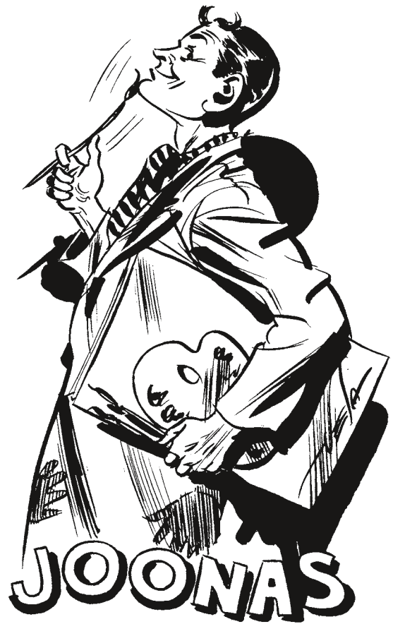
Tällä kuvalla Joonasta mainostettiin Helsingin Sanomissa vuonna 1950