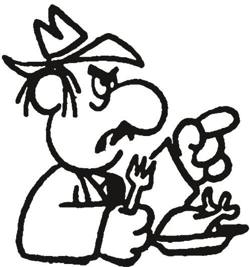
Gangsteri Allu Kaponen nähtiin parhaimmillaan noin kymmenessä lehdessä

Huutoon vastattiin pian. Piirtäjä-käsikirjoittaja Rauli Nordberg perusti samana vuonna Kalletuotanto Oy:n. Par-