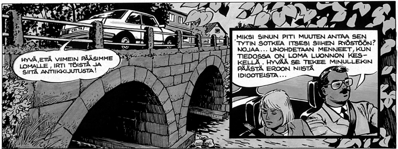
Murtosaaren ja Vaijärven Jake ilmestyi myös parina albumina